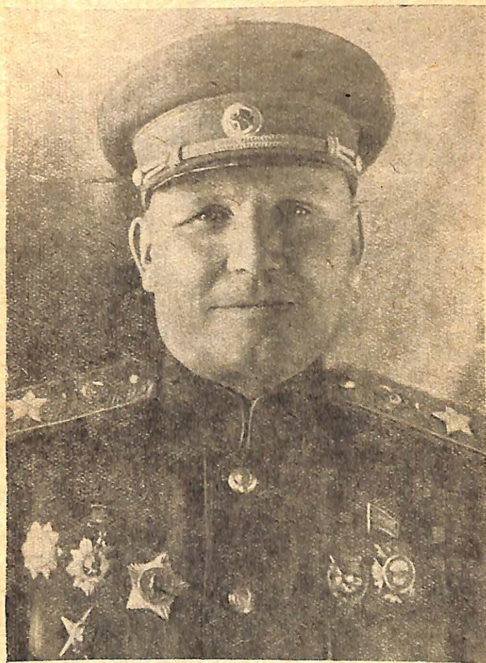
Герой Радянського Союзу Маршал Радянського Союзу І. С. КОНЄВ.